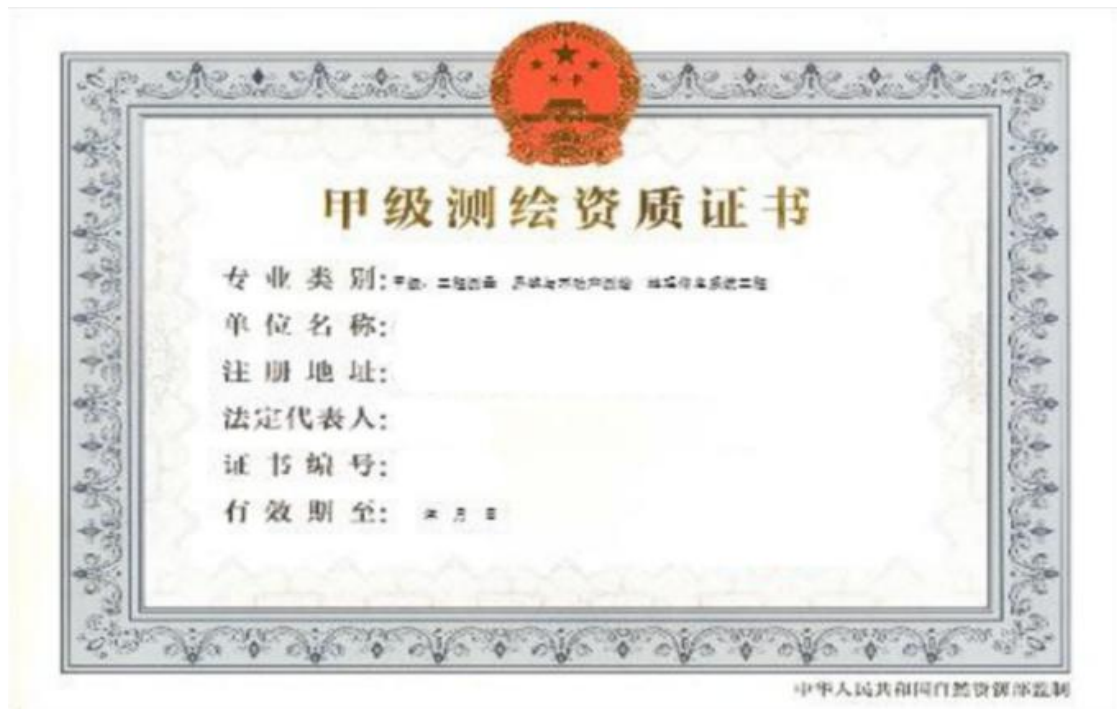
图 2. 专业范围记载有“界线与不动产测绘”的测绘资质证书